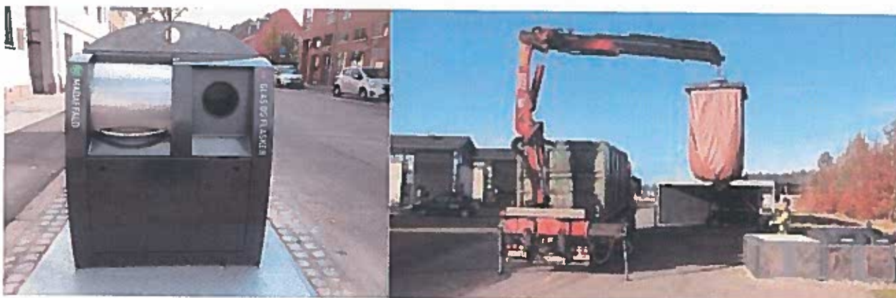
Eksempel på nedgravet affaldsløsning

På afdelingsmødet i 2017 blev det besluttet at afsætte penge til etablering af en ny nedgravet affaldsløsning i afdeling 606