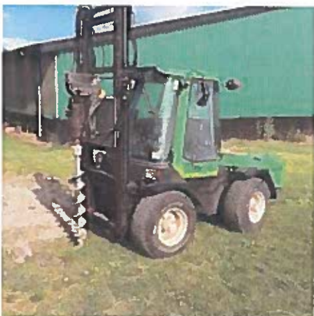
Sådan ser borevognen omtrent ud

Vi begynder med de indledende undersøgelser af jordbunden i slutningen af maj/start juni. Der vil i den forbindelse blive lavet nogle borer, så vi kan finde ud af, om der ligger noget i jorden som ikke fremgår af diverse tegninger, og som vi helst ikke skal grave ned i. Vi forventer at disse undersøgelser vil tage en uges tid.